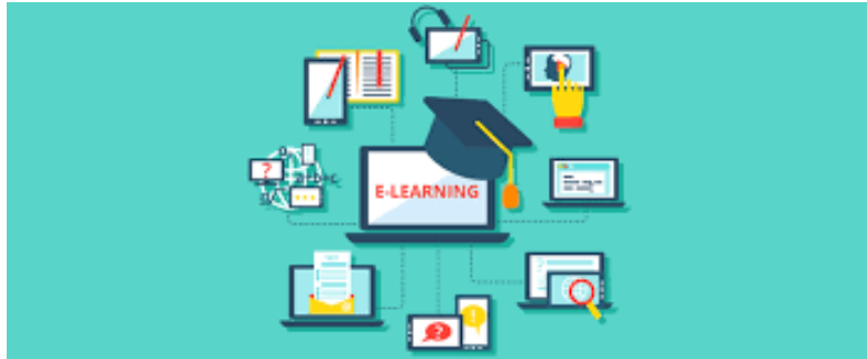
Modelo diseño elearning