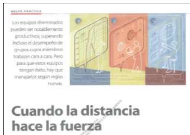
Figura 1: Captura de pantalla de la lectura, Cuando la distancia hace la fuerza, 2019

Entonces surge un problema: “¿Cómo los equipos diseminados pueden ser notablemente productivos?”, habría que probar si “la distancia hace la fuerza”; una posible hipótesis sería si los equipos que usan espacios online para mantener conversaciones virtuales son más efectivos que aquellos equipos que prefieren las reuniones cara a cara.