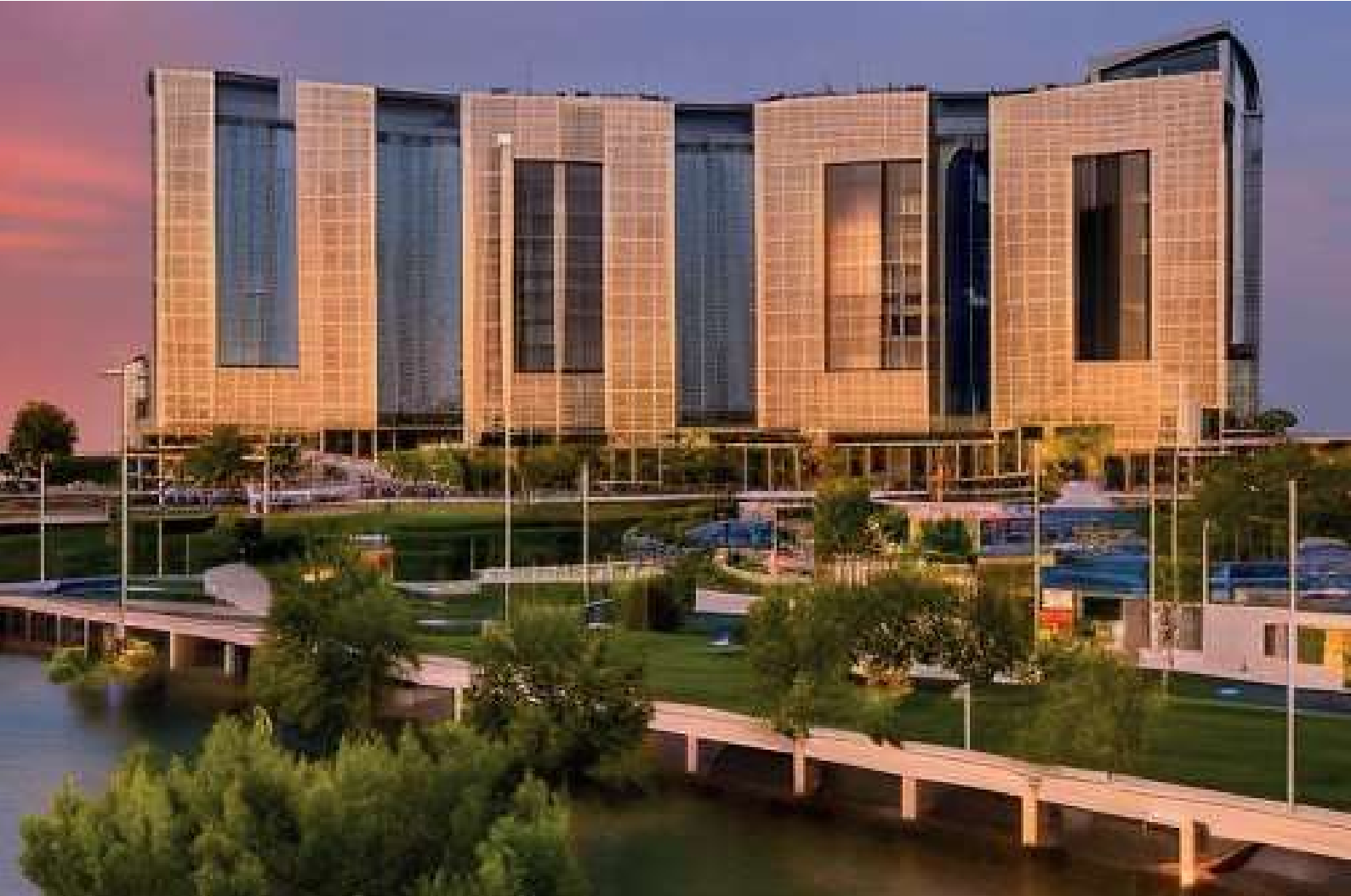
Imagen generada con Getimg.ai