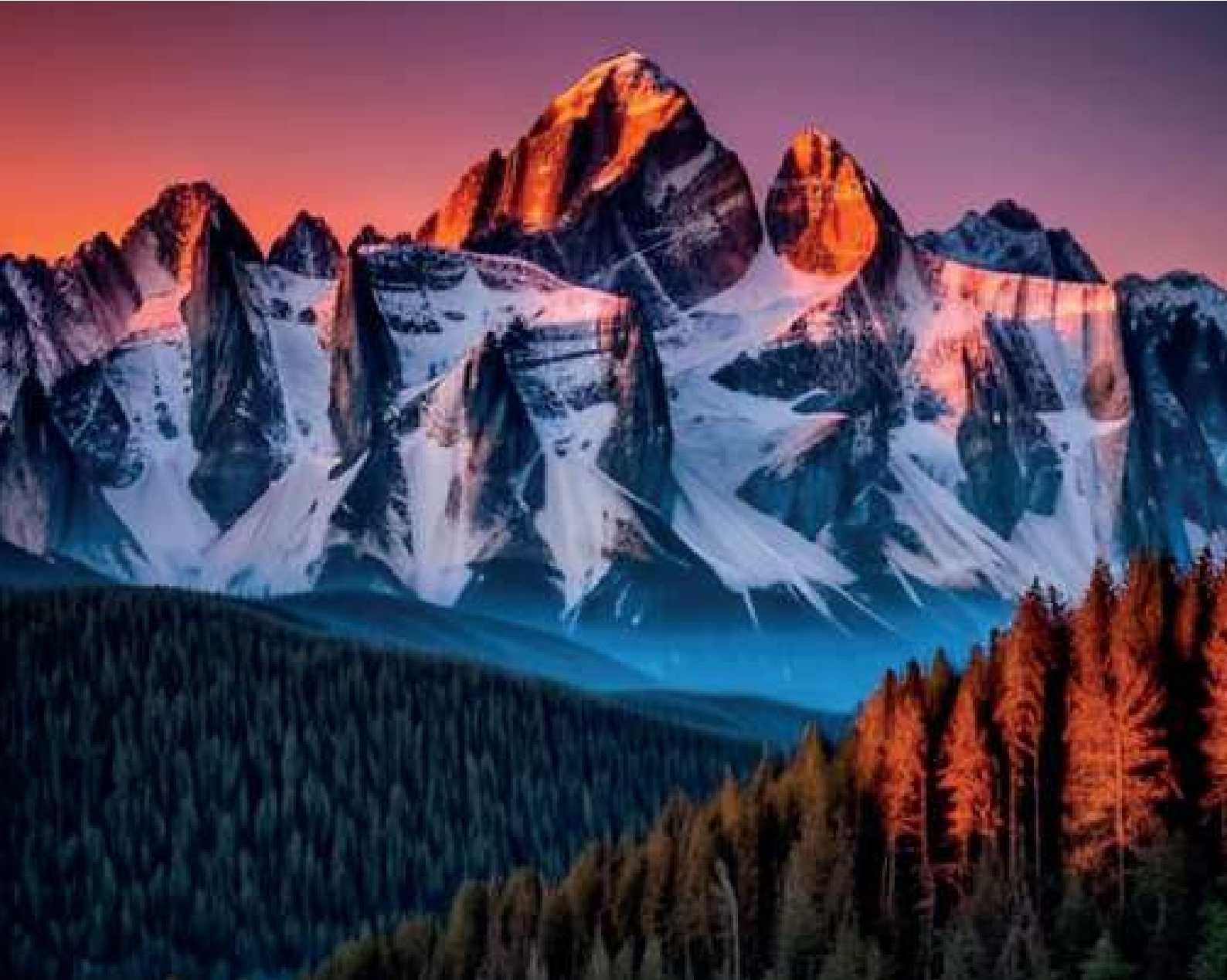
Imagen generada con Getimg.ai